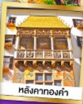
หลังคาทองคำ