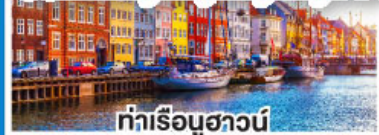
ท่าเรือฮาวน์

ล่องเรือสำราญสุดหรู DFDS พร้อมห้องพักแบบ Sea View