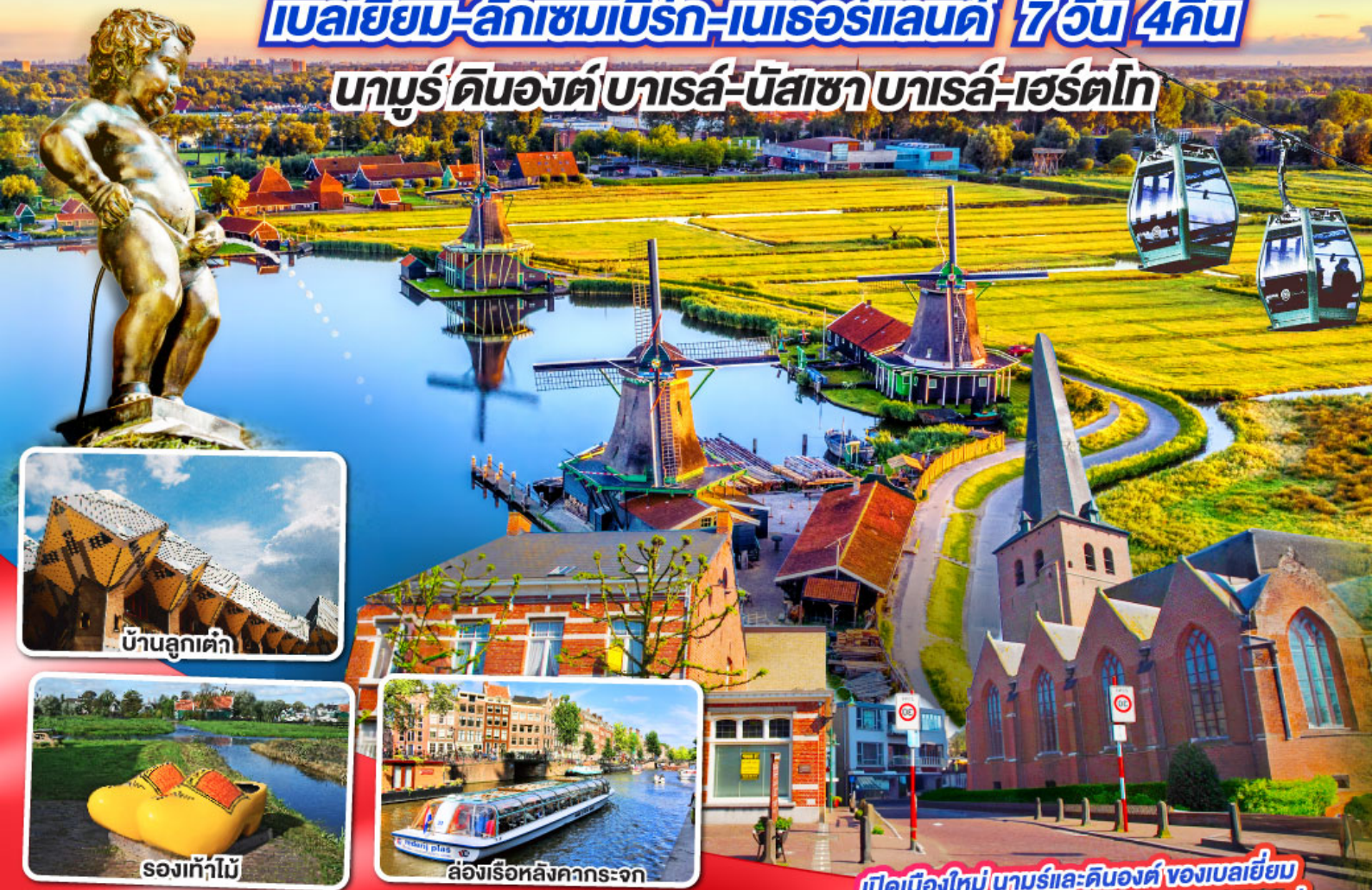
บ้านลูกเต่า

นามูร์-ดินองต์-บารส์-นัสซา-บารส์-เฮร์ตโท