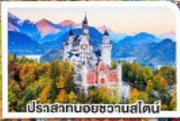
ปราสาทนอยชวานสไตน์