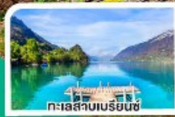
ทะเลสาบเบรียนซ์