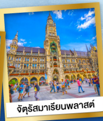
จัตุรัสมาเรียนพลาสต์