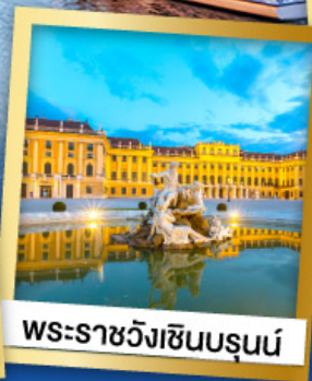
พระราชวังเซ็นบรุนน์