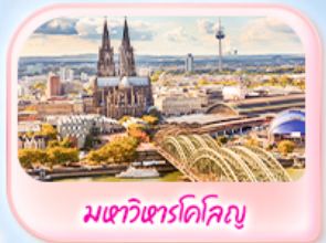
มทาวีตารโคโลญ