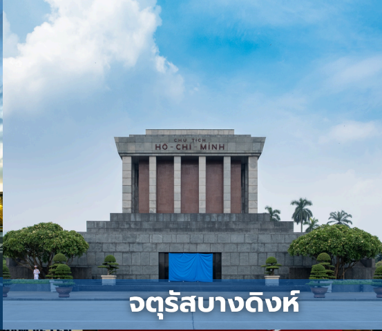
จตุรัสบางดิงห์