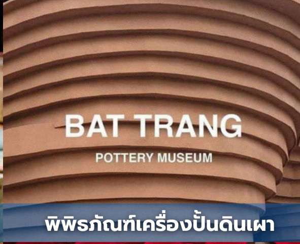
BAT TRANG POTTERY MUSEUM