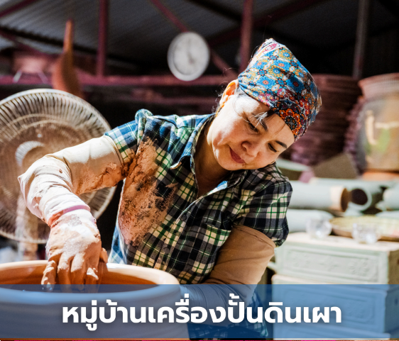
หมู่บ้านเครื่องปั้นดินเผา