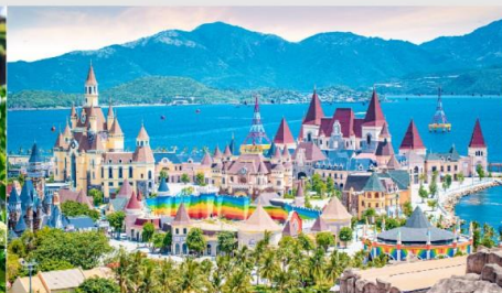
VinWonders NHA TRANG