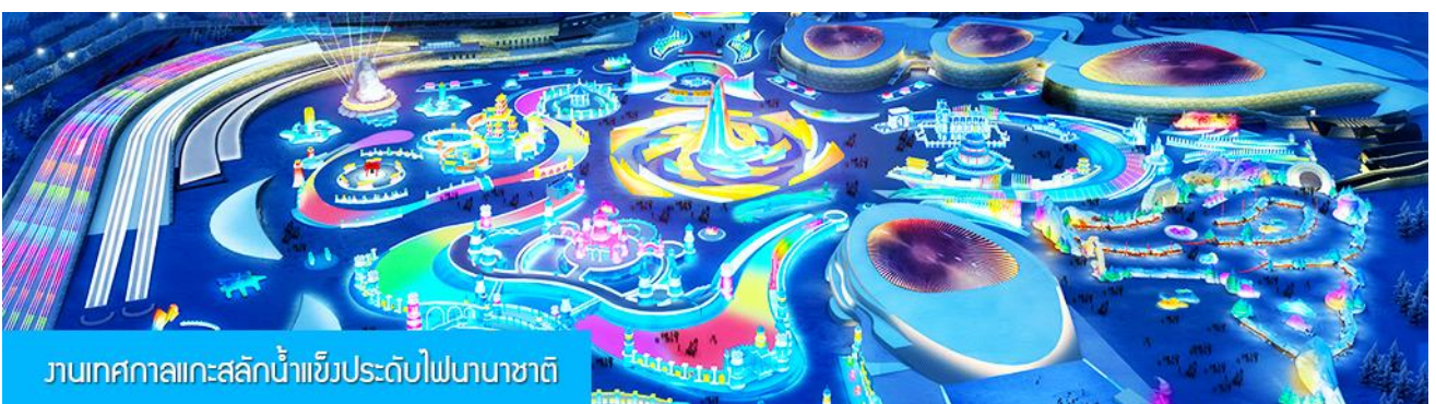
งานเทศกาลแกะสลักน้ำแข็งประดับไฟนานาชาติ

รับประทานอาหารค่ำ ณ ภัตตาคาร *เมนู สุกี้หม้อไฟ ปิ้งย่าง