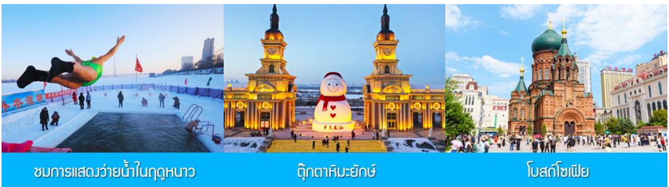
ชมการแสดงว่ายน้ำในฤดูหนาว

ค่ำ รับประทานอาหารค่ำ ณ ภัตตาคาร พักที่ HARBIN SHUIMU CITY SPRING HOTEL 4* หรือโรงแรมในระดับเดียวกันย่านชานเมืองฮาร์บิน