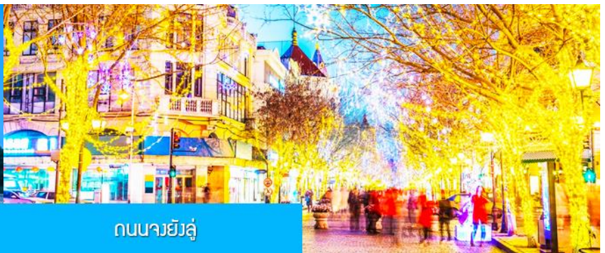
ถนนจงหยางต้าเจีย