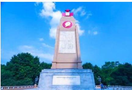
อนุสาวรีย์ฝิ่งหง

ชมและถ่ายภาพกับ รูปปั้นตึกตาคิมะยักซ์ 网红大雪人 เป็นตึกตาคิมะขนาดใหญ่ความสูง 18 เมตร ที่ทางเทศบาลเมืองฮาร์บินจัดทำขึ้นในช่วงฤดูหนาวของทุกปี เช่นเดียวกับการประดับต้นคริสต์มาสในช่วงเทศกาลของชาวตะวันตก จนกลายเป็นสัญลักษณ์แห่งฤดูหนาวของเมืองฮาร์บิน