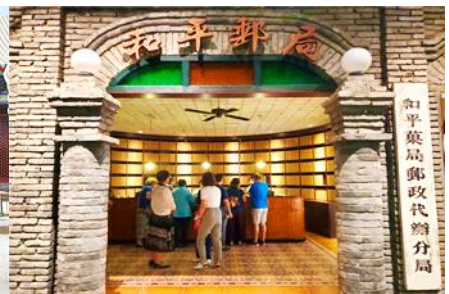
เมืองโบราณจำลอง