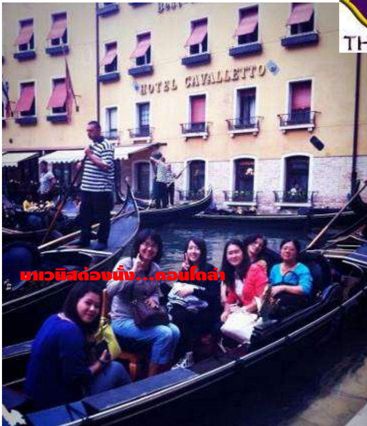
มาเวนิสต้องนั่ง...คอนโดล่า