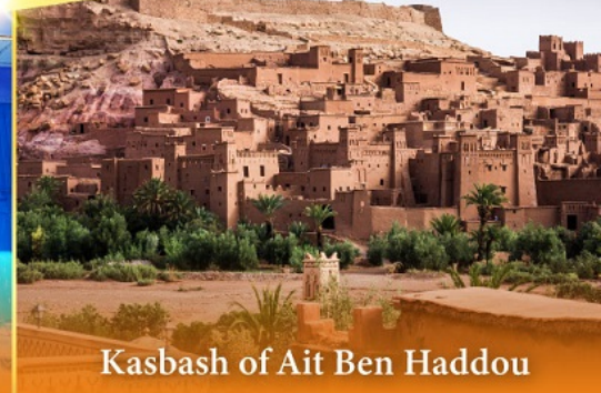
Kasbah of Ait Ben Haddou