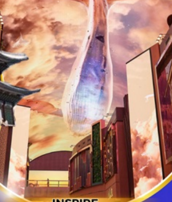
INSPIRE Entertainment Resort

ใหม่!! ห้องสมุดสุดอลังการที่ชวอน ชมจอ LED เสมือนจริงขนาดยักษ์ สนุกสุดมันส์ที่สวนสนุกเอเวอร์แลนด์ ชมพระราชวังเคียงบกกุง ถนนวัฒนธรรมอินชาง อิสระช้อปปิ้งคังนัม เมียงดง Lotte Duty Free