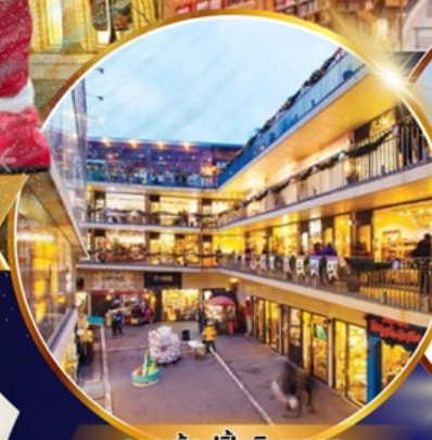
ถนนช้อปปิ้งอินชาง