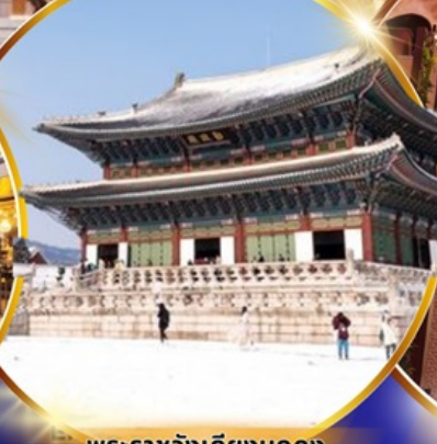
พระราชวังเคียงบกกุง