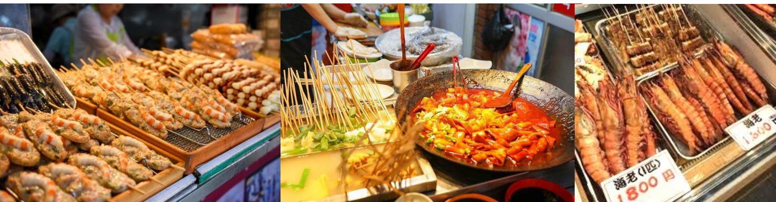
เที่ยวเพลิน แคมอิ่มท้อง

ให้ท่านอิสระ ที่ตลาดแฮอินแด แหล่งช้อปปิ้ง สุดฮิต เกาหลี เกาหลี เป็นตลาดแห่งเดียวของเกาหลีใต้ที่ตั้งอยู่ใกล้ชายหาดแฮอินแด ซึ่งถือว่าเป็นชายหาดที่มีชื่อเสียงมากที่สุดในประเทศเกาหลีใต้ เพราะชาวเกาหลีนิยมมาเที่ยวในฤดูร้อน เป็นถนนสายเล็กๆ มีร้านอาหารเปิดขายของตั้งแต่เช้าจนถึงช่วงดึก ตลาดแห่งนี้ยิ่งดึกยิ่งคึกคัก นักท่องเที่ยวนิยมไปเดินชิว ภายในตลาดมีความสะอาดอ่าน มีร้านค้าพร้อมป้ายสัญลักษณ์ที่มีมาตรฐาน มีร้านจำหน่ายอาหารพื้นบ้านให้ได้ลิ้มลอง รสชาติ มีร้านค้าที่จำหน่ายผลิตภัณฑ์ที่หลากหลาย แปลกตา แล้วก็ต้องมีร้านอาหารทะเลสดๆ เพราะใกล้แหล่ง มีแผงขายอาหารแบบสตรีทฟู้ด ร้านอาหารให้เลือกรับ และร้านค้าจำหน่ายขนมของฝากท้องถิ่น เรียกได้ว่า เดิน