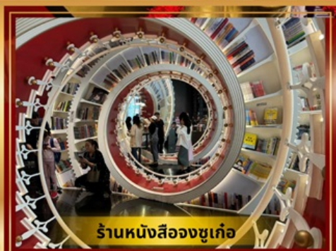
ร้านหนังสือจวงซูเก้อ