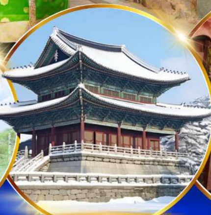
พระราชวังเคียงบกคยอง