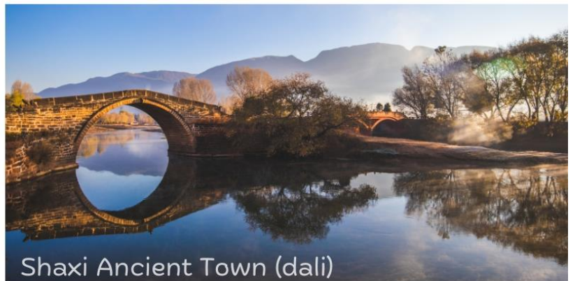
Shaxi Ancient Town (dali)