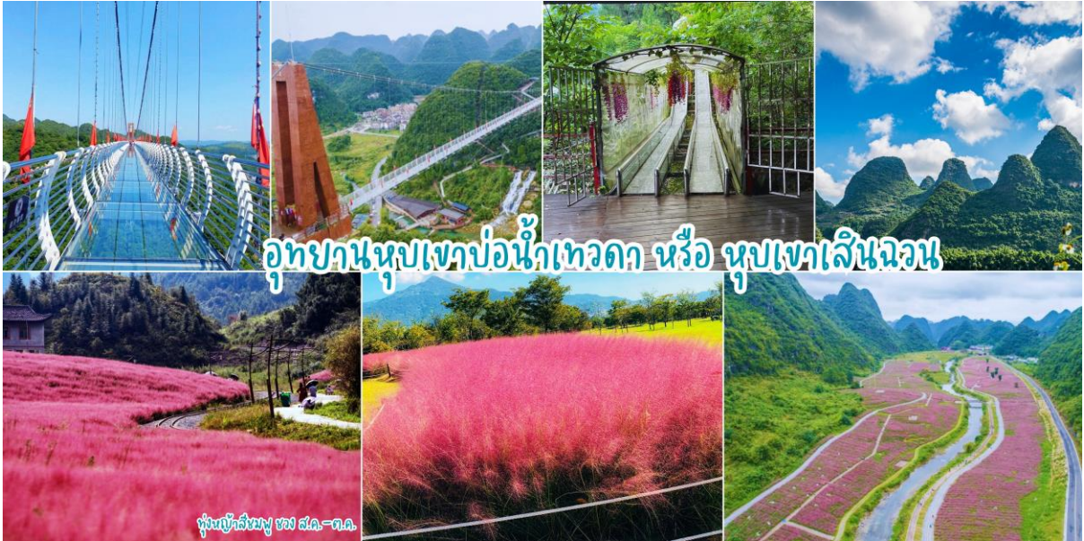
อุทยานหุบเขาบ่อน้ำเทวดา หรือ หุบเขาเสินฉวน

เช้า ๑๐|รับประทานอาหารเช้า ณ ห้องอาหารของโรงแรม หลังอาหารเช้าท่านเดินทาง อุทยานหุบเขาบ่อน้ำเทวดา หรือ หุบเขาเสินฉวน (ค่ารถबाटเตอร์รี่) มณฑลกุ้ยโจว เป็นแหล่งท่องเที่ยวที่คุณจะได้สัมผัส ดื่มด่ำกับธรรมชาติอย่างแท้จริง และสถานที่แห่งนั้นก็คือ “จุดชมวิวกุ้ยเขาเสินฉวน” เป็นสถานที่ท่องเที่ยวสุด UNSEEN ที่ชื่อเสียงของชาวจีน จุดชมวิวกุ้ยเขาเสินฉวน ตั้งอยู่ท่ามกลางธรรมชาติ ขุนเขา ป่าไม้ ธารน้ำและทุ่งดอกไม้ ที่อุดมสมบูรณ์สวยงาม ในเขตปกครองตนเองชนกลุ่มน้อยเผ่าเหมียวและปู้อี้ ฉะเหมินหนาน อำเภอฉางชุ่น มณฑลกุ้ยโจวทางตะวันตกเฉียงใต้ของจีน ซึ่งเสน่ห์ที่ชวนดึงดูดให้นักท่องเที่ยวผู้ชื่นชอบธรรมชาติจากทั่วทุกสารทิศอยากจะมาเยือนที่จุดชมวิวกุ้ยเขาเสินฉวนแห่งนี้ นำท่านชมบ่อน้ำเทวดา ลักษณะเป็นบ่อน้ำพลูร้อนที่เกิดขึ้นตามธรรมชาติ เป็นสถานที่ที่ชาวกุ้ยโกวนิยมมาขอพรให้กิจการการงานราบรื่น จากนั้นนำท่านชมวิวกุ้ยเขาที่หยอด โดยสัมผัสความหวาดเสียว ณ สะพานกระจกหุบเขาน้ำพลูเทวดา (รวมค่าบัตรโดยสาร 1เที่ยว) สะพานแก้วมีความยาว 324 เมตร สูง 188 เมตร ให้ท่านได้ชมวิวดงงามด้วยยอดเขาที่หนาแน่นและแปลกตาและภาพรวมที่สมบูรณ์แบบ รูปร่าง ได้รับการยกย่องจากผู้เชี่ยวชาญและนักท่องเที่ยวมากมายว่าเป็น “สิ่งมหัศจรรย์ของโลก” นำท่านชมทุ่งดอกไม้ตามฤดูกาลที่มีความสวยงามแฉะถ้าयरูปตามจุดชมวิวกุ้ยเขา (ในช่วงเดือน พ.ค.-ส.ค.67 ท่านจะได้ชมทุ่งทานตะวันหรือดอกไม้อื่นๆ // ในช่วงปลายส.ค.-ต.ค.67ท่านจะได้ชมทุ่งหญ้าสีชมพู)