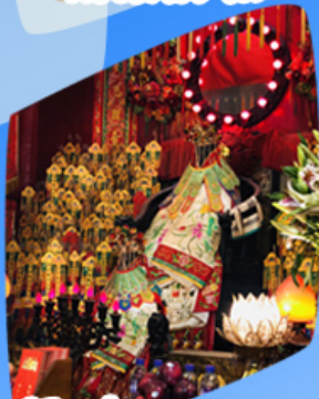
เจ้าแม่กวนอิมซี่มเงิน