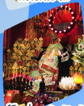
เจ้าแม่กวนอิมยิ้มเงิน