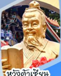
หวังต้าเซียน