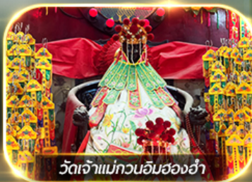
วัดเจ้าแม่กวนอิมสองอ้า