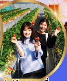
บุฟเฟต์ สตอเบอร์รี่ เก็บสดจากต้น