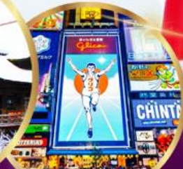
ช้อปปิ้ง ซินโซบาชิ