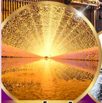
นาบานะ โนะ ซาโตะ