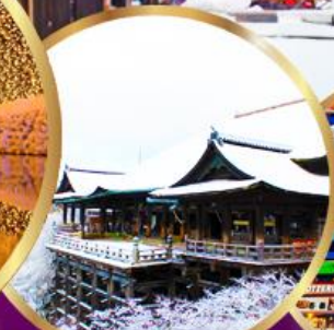
วัด คิโยมิจิ