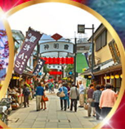
ย่านโบราณ ชิบูยะ