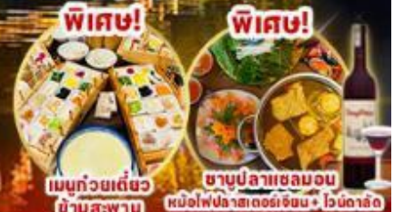
เมนูถ้วยเต๋อชว่