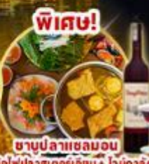
ซาบูปลาหมอลอน หม้อไฟปลาสดอร่อยเข้มข้น + ไวน์ดาด