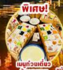
เมนูถ้วยเต๋อซว๋ ซ้ำมสะพาน