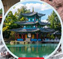
สระมังกรคำ