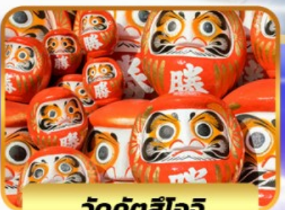
วัดคัตสึโงจิ