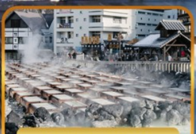
ชมยูบาทาเกะ