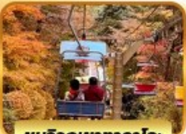
ชมวิวกุเขากาโตะ