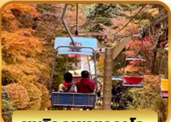
ชมวิวกุเขาทาคาโอะ