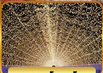
นาบะนะโนะซาโตะ