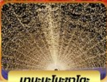
น้ำตกนิชิโนะคาโตะ