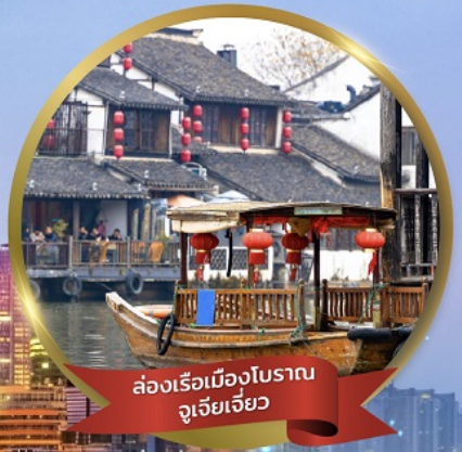
ล่องเรือเมืองโบราณจู่เจียเจี้ยว

เต็มอิ่มเที่ยวสวนสนุกดิสนีย์แลนด์ • ล่องเรือเมืองโบราณจู่เจียเจี้ยว นั่งรถไฟลอดอุโมงค์เลเซอร์ • ชมหอไข่มุก • ถนนนานจิง • POP MART วัดจิ่งอัน • อาคารพันต้นไม้ • ตลาดร้อยปีเงินหวงเมี้ยว