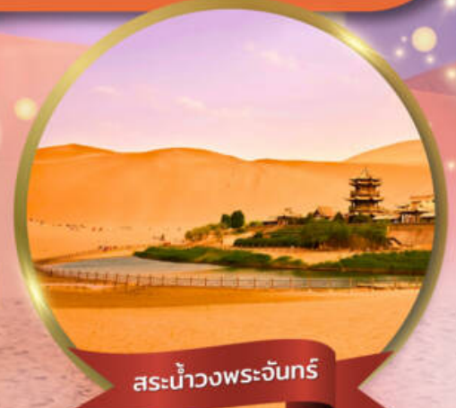
สระน้ำวงพระจันทร์