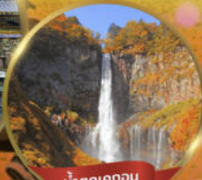
น้ำตกเคออน