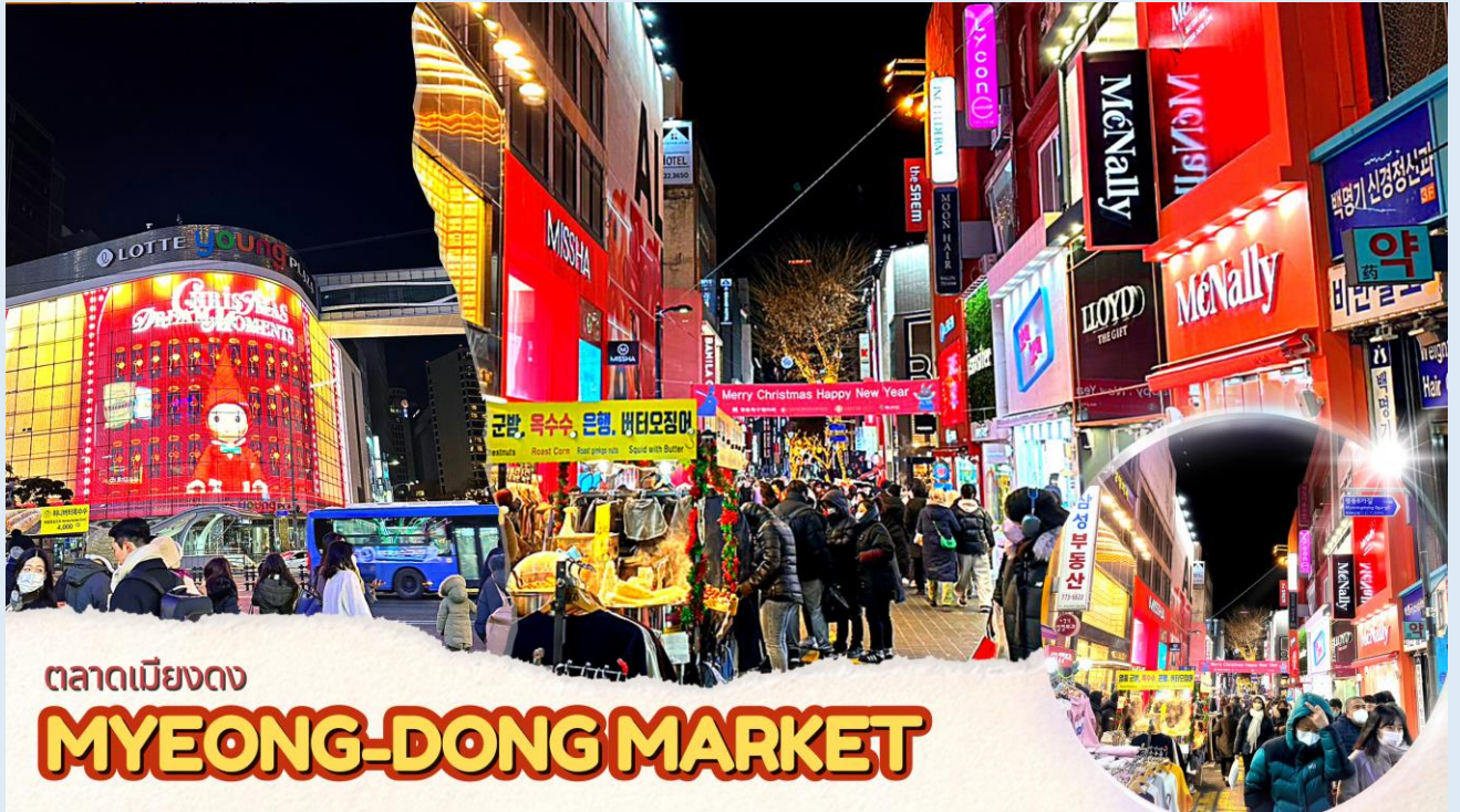
ตลาดเมียงดง MYEONG-DONG MARKET

จากนั้นนำท่านช้อปปิ้งย่าน เมียงดง หรือสยามสแควร์เกาหลี หากท่านต้องการทราบว่าแพชั่นของเกาหลีเป็นอย่างไร ก้าวล้าทันสมัยเพียงใดท่านจะต้องมาที่เมียงดงแห่งนี้ พบกับสินค้าวัยรุ่น อาทิ เสื้อผ้าแฟชั่นแบบอินเทรนด์ เครื่องสำอางต่าง ๆ ของเกาหลี พบกับความแปลกใหม่ในการช้อปปิ้งอีกรูปแบบหนึ่ง ซึ่งเมียงดงแห่งนี้จะมีวัยรุ่นหนุ่มสาวชาวโสมไปรวมตัวกันที่นี้กว่าล้านคนในแต่ละวัน