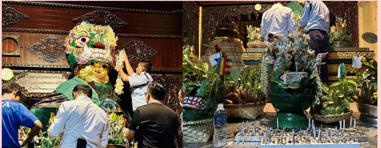
วิธีการขอพรจากแม่ยักษ์

พาท่านเดินไปขอพรที่ แม่ยักษ์ ผู้ปกป้องดูแลเจดีย์ คนพม่าเชื่อว่าแม่ยักษ์...จะช่วยในการตัดกรรมจากเจ้ากรรมนายเวร โดยเฉพาะอย่างยิ่งผู้ที่มีเวรกรรมกับเจ้ากรรมนายเวรทั้งหลายช่วยขจัดเคราะห์กรรม ขจัดอุปสรรค ติดขัดต่างๆ ความสำเร็จอธิษฐานขอให้ท่านช่วย ให้ชีวิตของคุณมีแต่ดีขึ้นเรื่อยๆ ซึ่งถ้าหากคุณกำลังมีทุกข์และหาหนทางไม่ออก ก็ลองมาไหว้ขอพรจะแม่ยักษ์ให้ช่วยบันดาลให้สิ่งร้ายๆ สิ่งไม่ดี ออกไปจากชีวิต และขอให้ชีวิตมีแต่สิ่งดีๆเข้ามา นอกจากนี้ยังเชื่อกันว่าแม่ยักษ์...ยังช่วยเรื่องความมีชื่อเสียงโด่งดัง เป็นที่รู้จักก้าวหน้าในหน้าที่การงาน ใครที่ตกงานอยู่ จุดนี้เป็นอีกหนึ่งจุดที่ต้องห้ามพลาด ปล.แม่ยักษ์จะประดิษฐานอยู่ติดกับบันไดประตูทางทิศตะวันออกค่ะ