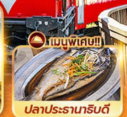
ปลาประดานาธิบดี

Highlight... เกี้ยว 3 อุทยาน 6 วัน 4 คืน