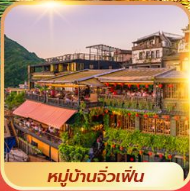
หมู่บ้านจิวเฟิน