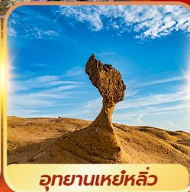
อุทยานเหยหลิว