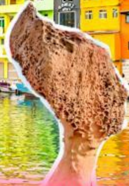
อุทยานเหย์หลิว