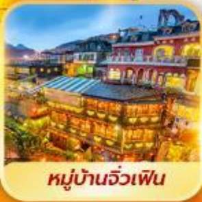
หมู่บ้านจิวเฟิน