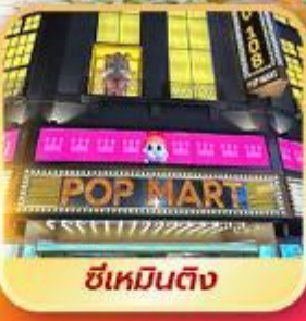
ซีเหมินติง