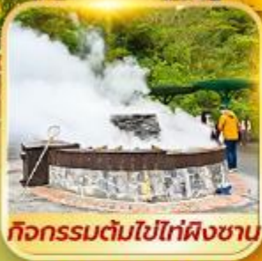
กิจกรรมต้มไข่ไท่ผิงซาน