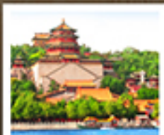
อวี่เหอหยวน