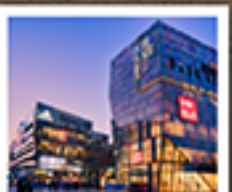
ย่านซานหลี่ตุ๋น