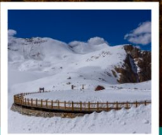
ต้ากู่ปิงชวน