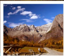
กุหลาสดรณี