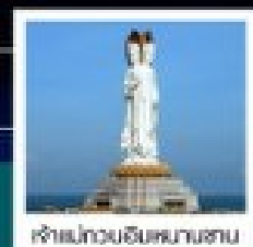
เจ้าแม่กวนอิมทะเล