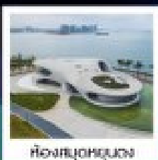
หอสมุดหยุนหลง