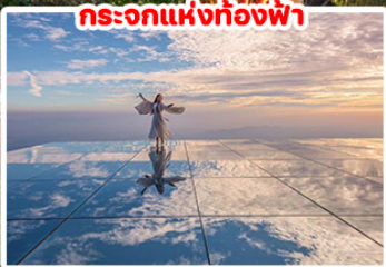
กระบอกแห่งท้องฟ้า