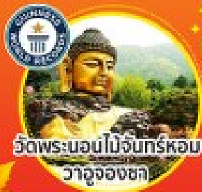
วัดพระบอมนมโง่นทร์หอม วาจุงองชกา