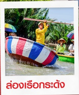
ล่องเรือกระดิง