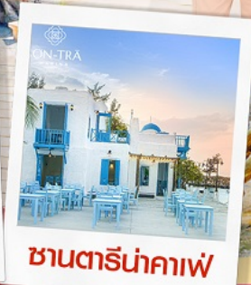
ซานตารีน่าคาเฟ่