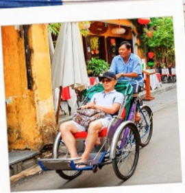
รถสามล้อ Cyclo