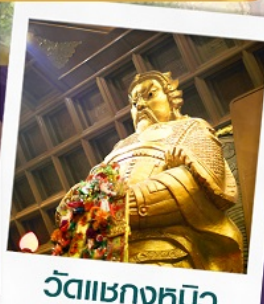
วัดเขาหงษ์มี้ว