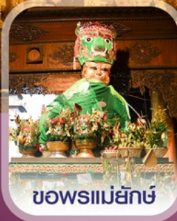
ชอพรแม่ยักษ์

✈️ คอนเฟิร์มออกเดินทาง ทุกพีเรียด 2 ท่านขึ้นไป