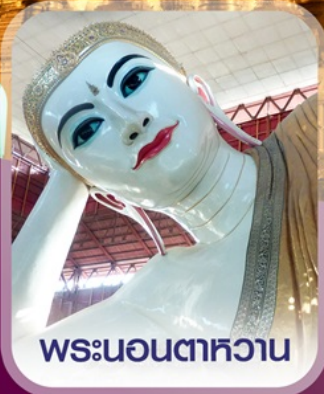
พระนอนตาทาวน