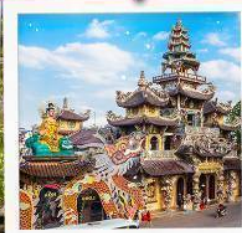
วัดมังกร