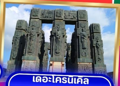
เดอะโครนเคิล ออฟ จอร์เจีย

พิเศษ.. ทดลองชิมไวน์ 3 ชนิด ต้นตำรับของจอร์เจีย