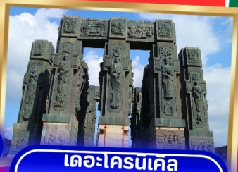
เดอะโครนเคิล ออฟ จอร์เจีย