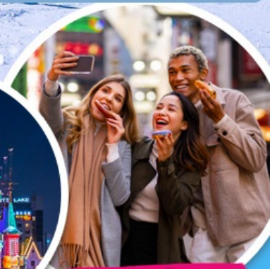
ตลาดเมียงดง