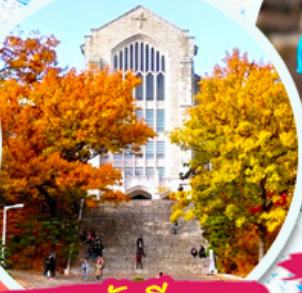
มหาลัยฮ็ฮวา