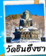
วัดชินฮังซา