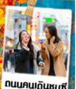
ถนนคนเดินชุนซี