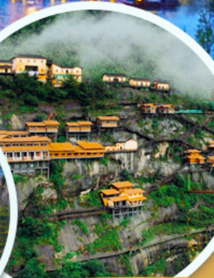
ชมเขาเทวดา